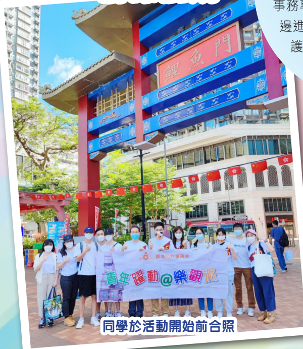
同學於活動開始前合照