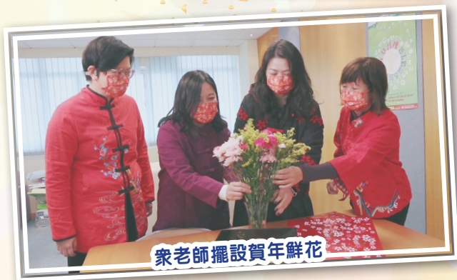
眾老師擺設賀年鮮花

每年農曆新年前夕，本校皆舉辦中華文化日，本年度亦不例外。本年度的中華文化日於1月27日（年廿五）舉行，由中文科、中國歷史科及學生會合辦。當天因疫情關係大部分活動只好改為網上進行，但一如既往節目豐富。校長及眾老師預先錄製賀新春短片「中華文化日虎年賀歲」，於當天早會播放，學生可感染新年氣氛，表現雀躍。老師鼓勵學生參加網上問答遊戲及猜燈謎，學生可藉此認識中國傳統習俗文化，更可透過遊戲獲取禮物，各項活動深受學生歡迎。