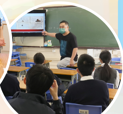
講者分享創作經驗