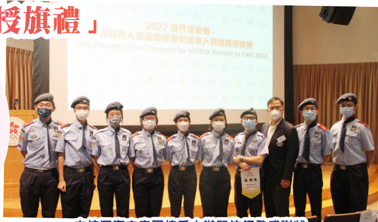
本校深資空童軍接受主辦單位頒發感謝狀

本校深資空童軍協助香港無人機運動總會舉行「2022年世界運動會——競速無人機港隊授旗禮」，各團員在是次典禮擔任不同服務崗位，包括司儀、攝影、錄影、接待等，表現出色，盡展服務精神，獲主辦單位稱許。