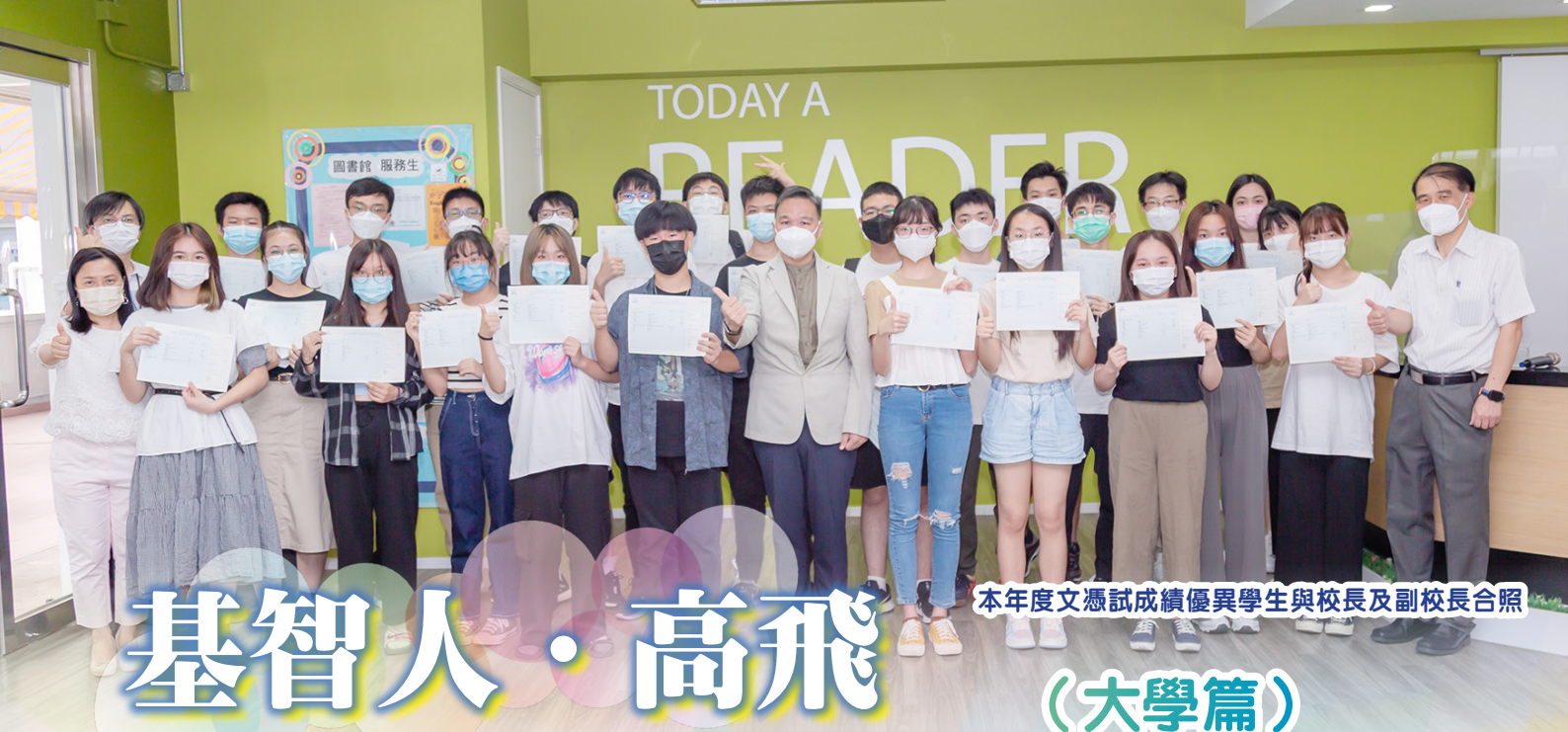
本年度文憑試成績優異學生與校長及副校長合照