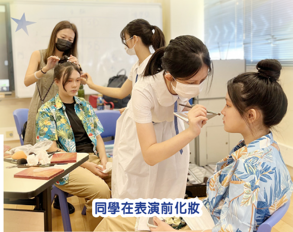
同學在表演前化妝