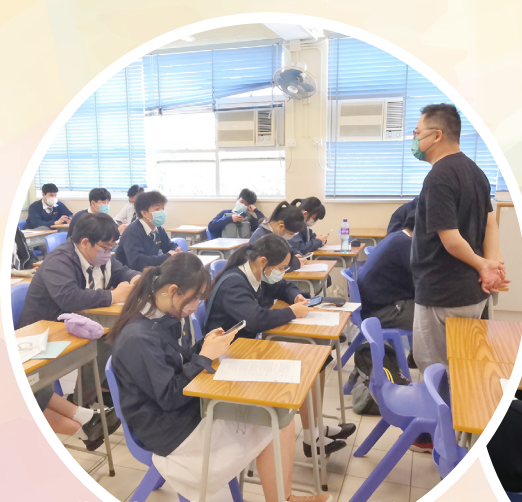
學生上課時使用手提電話進行創作

本校於去年12月的兩個周六早上，舉辦作家創作工作坊，邀請了著名作家袁兆昌擔任導師，指導本校中三至中五級共五十多位學生中文創作的技巧，學生積極投入，獲益良多。