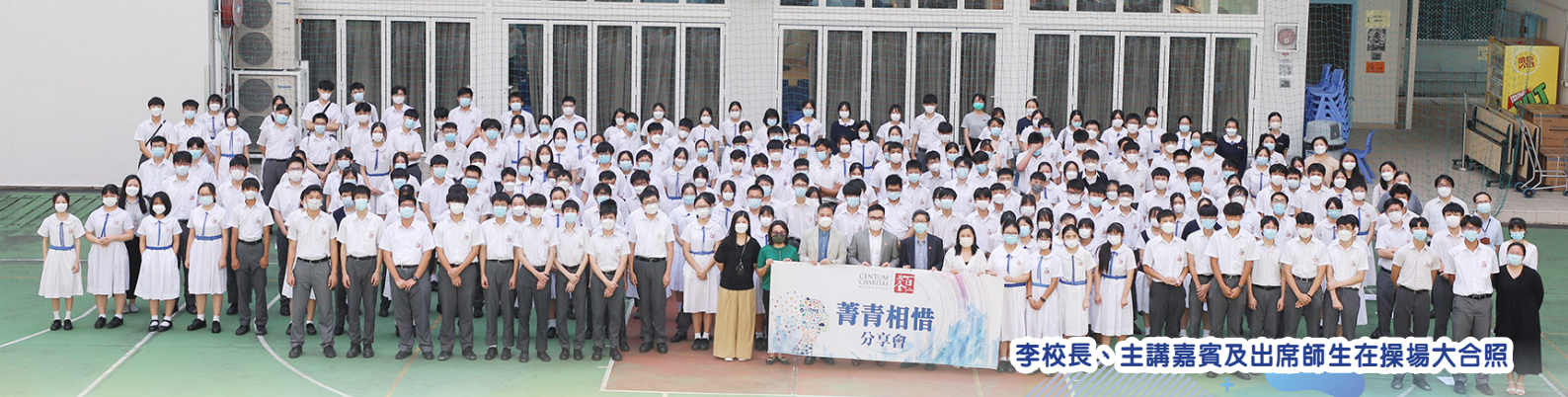
李校長、主講嘉賓及出席師生在操場大合照