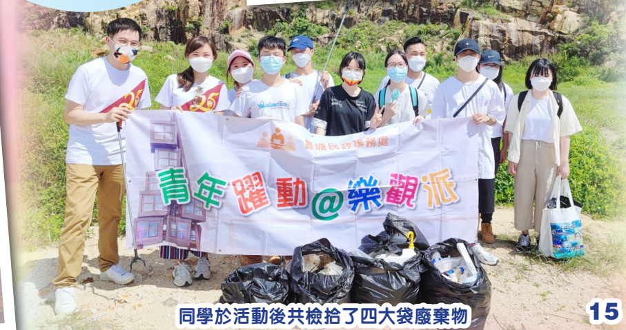
同學於活動後共檢拾了四大袋廢棄物