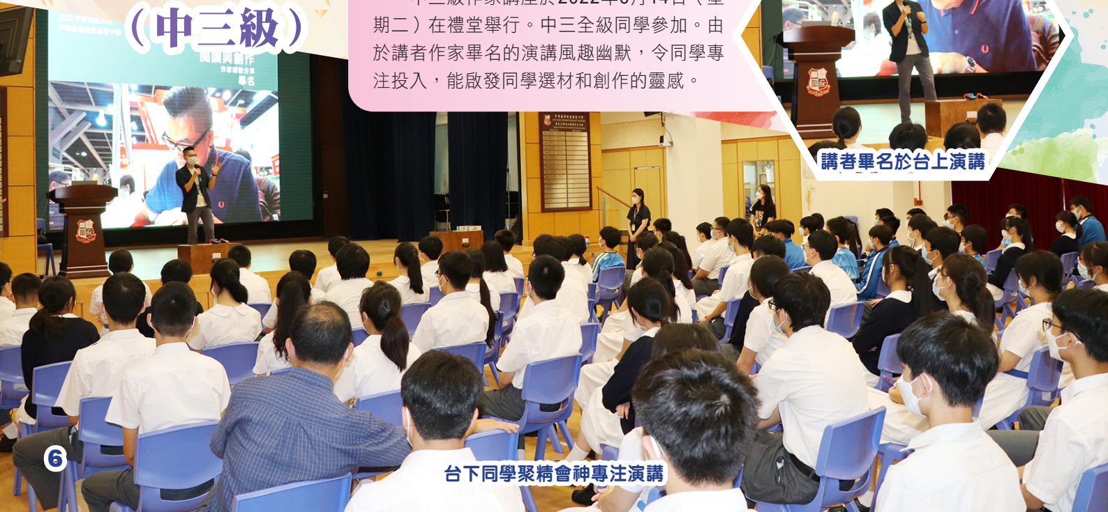
台下同學聚精會神專注演講