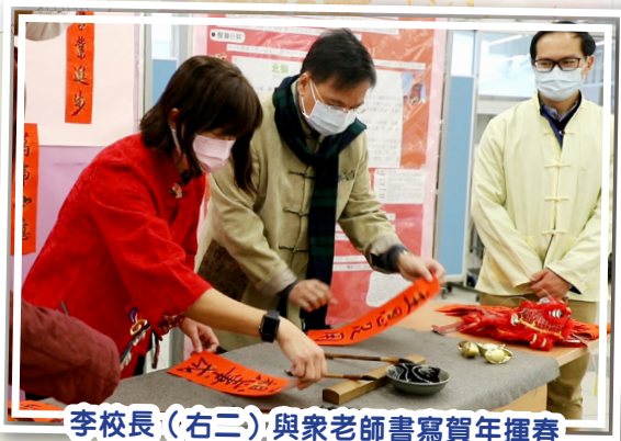
李校長（右二）與眾老師書寫賀年揮春