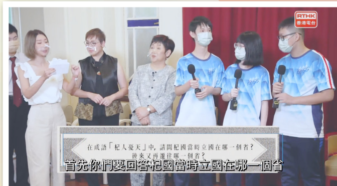
本校參賽同學即時回答主持提問

由香港電台電視部製作「行走中的文化」電視節目，包含由中國文化不同領域的專家或賢達帶領學生進行體驗式學習。本校學生於「中國飲食」單元比賽獲得殿軍，並參與香港電台節目錄製。