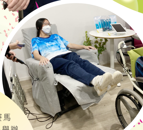
學生試坐電動護理椅

21位本校社會服務領袖生參加由明愛賽馬會照顧者資源及支援中心舉辦的中學生「護老同行成長坊」，透過體驗活動（穿脫老化體驗衣、飲食凝固粉、使用復康器材、角色扮演等）、樂齡科技及無障礙設施參觀，讓學生瞭解安老服務、護老者服務的職業生涯規劃，學生投入活動。