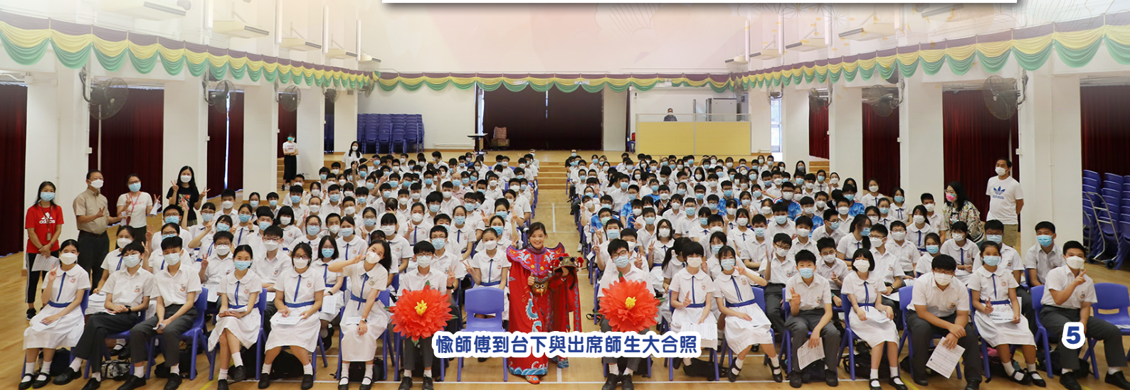
愉師傅到台下與出席師生大合照