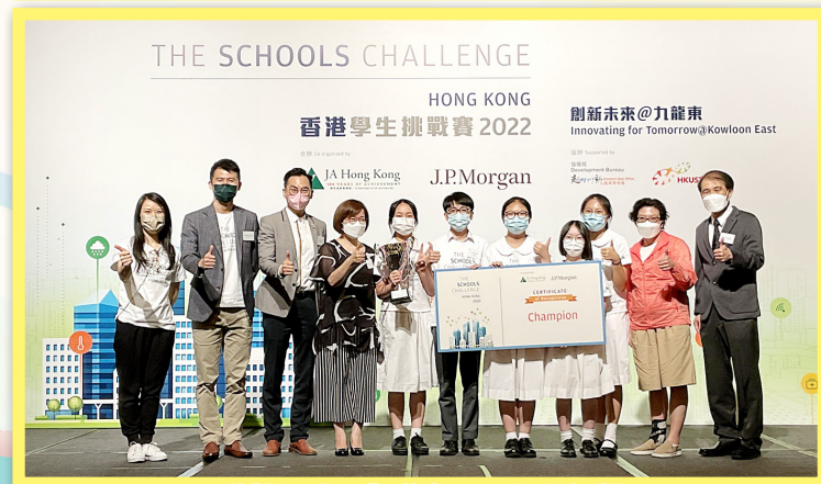
獲獎同學及指導老師到台上領獎

本校進入8強的隊伍，並於2022年6月25日（星期六）參加在九龍灣國際展貿中心(KITEC)舉行決賽。最終勇奪冠軍和季軍的佳績，冠軍隊伍同時奪得最具人氣解決方案獎，特此恭賀各得獎同學。