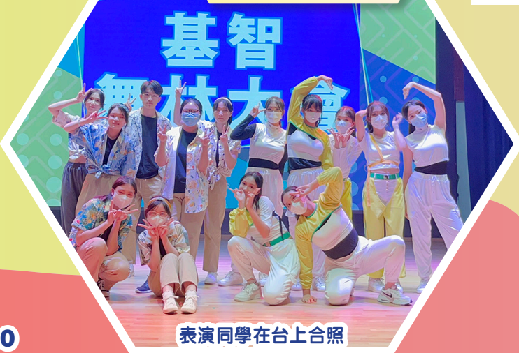
表演同學在台上合照