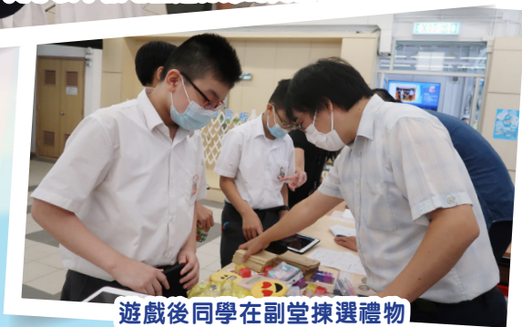
遊戲後同學在副堂揀選禮物