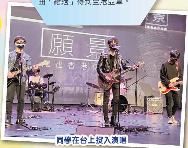
同學在台上投入演唱