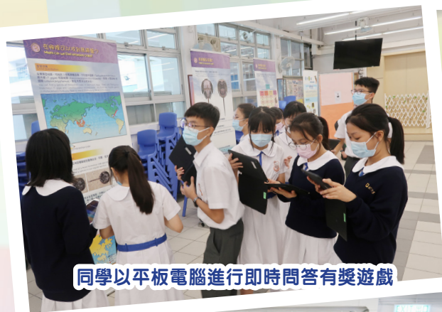
同學以平板電腦進行即時問答有獎遊戲