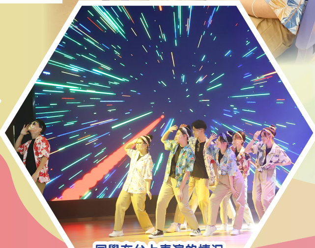
同學在台上表演的情況