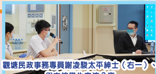
觀塘民政事務專員謝凌駿太平紳士（右一）、 與本校學生交流分享

觀塘民政事務專員謝凌駿太平紳士於2021年10月27日（星期三）到校參觀探訪，並與參加樂觀派活動的同學及學生會兩屆主席交流分享。謝專員其後獲校園電視台邀請接受「校長會客室」之訪問，分享自己的生涯規劃經歷，並寄語本校同學在逆境時仍要奮發自強，為自己為社會創造更美好的未來！