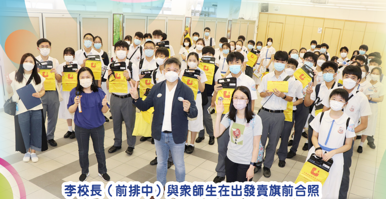
李校長（前排中）與眾師生在出發賣旗前合照