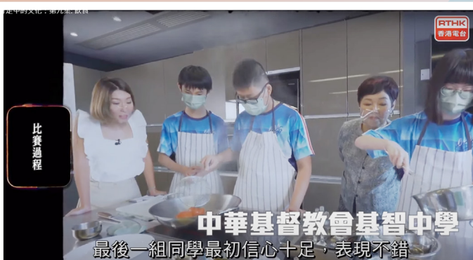
本校參賽同學參與拍攝片段