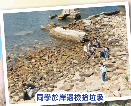
同學於岸邊檢拾垃圾

本校青年躍動@樂觀派的同學於2022年6月26日（星期日）參加觀塘民政事務處主辦的活動，與觀塘民政事務專員等人一起，於鯉魚門海邊進行清潔活動，大家同為保護環境出一分力。