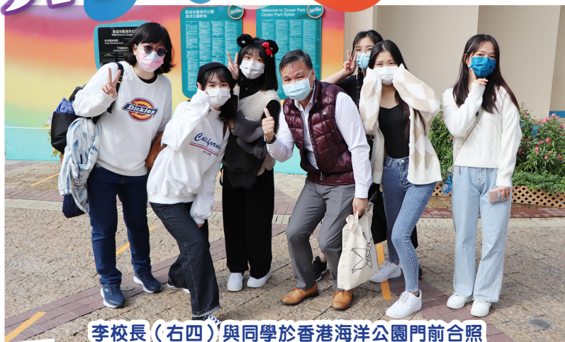
李校長（右四）與同學於香港海洋公園門前合照

本校於2021年11月25日（星期五）舉行全方位學習日，中一至中六級學生及全體老師到香港海洋公園進行活動，寓學習於娛樂。