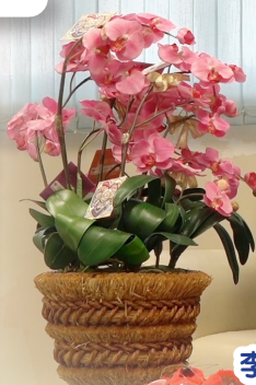
李校長與同學向各位拜早年