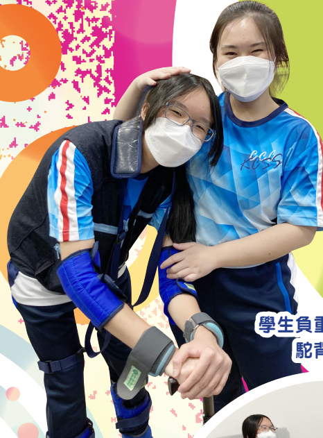
學生負重模擬長者駝背感受

中五級五位4C青年義工領袖計劃的團員將本校學生親手製作的扇子，連同抗疫物資（食物、口罩、檢測劑盒）送給20位獨居長者，在疫情中送上最真摯的祝福及關懷。