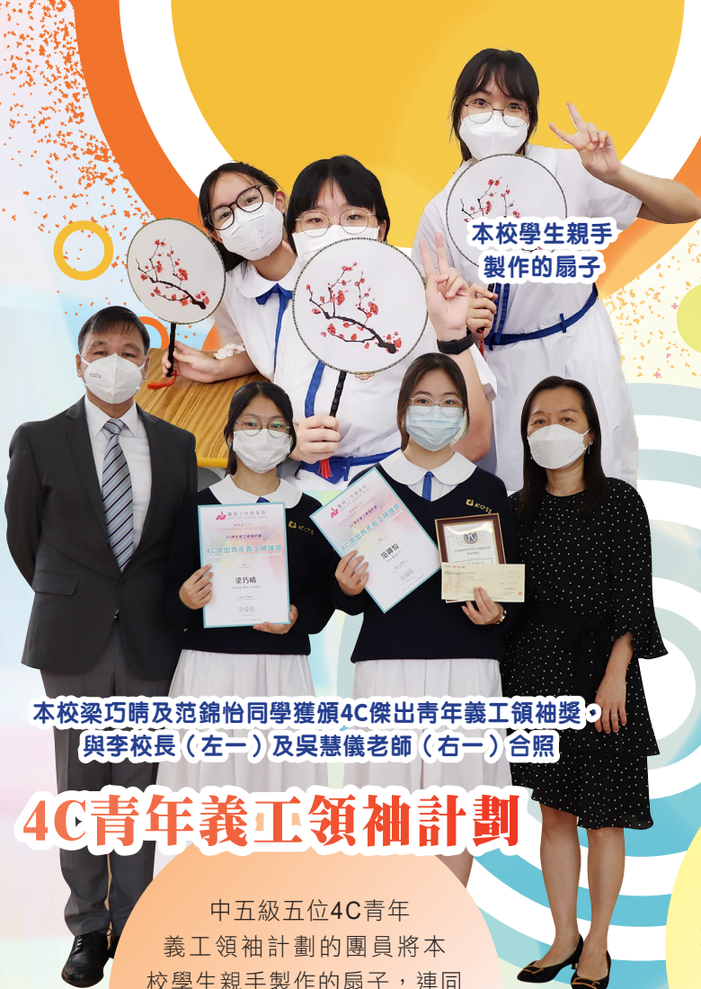
本校學生親手製作的扇子